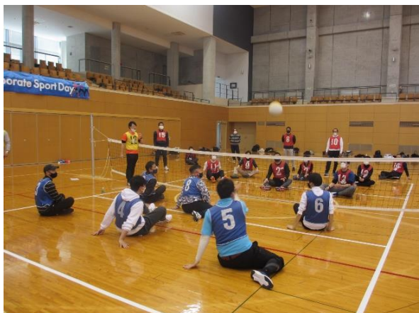
シッティングバレーでは パラスポーツの難しさを体感