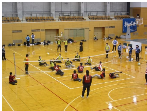
対戦中のチーム以外の参加者も 声を出して応援