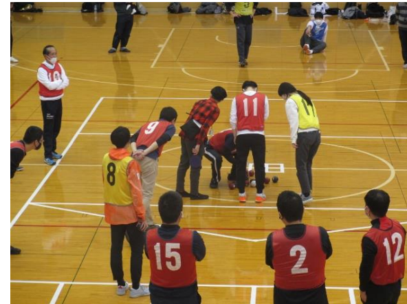
審判は全員参加型で行った ミリ単位でボールの位置を確認