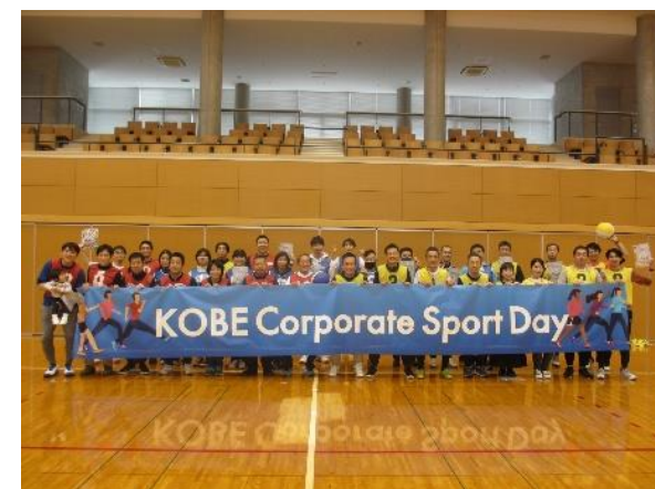
最後は参加者全員で 横断幕をもって記念撮影