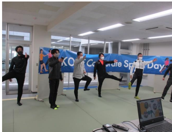
明治安田生命保険(相)の 「みんなの健活」動画にて準備運動