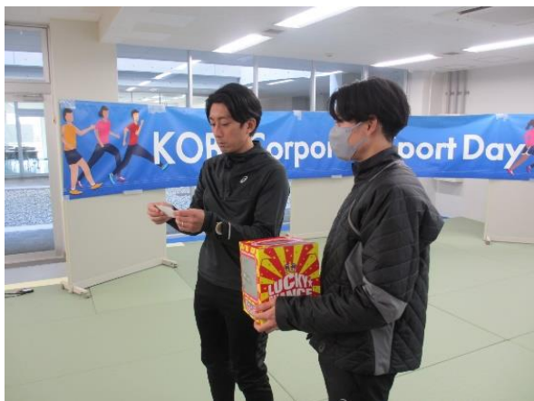
抽選会では参加企業からの 協賛品の当選者をお場で発表