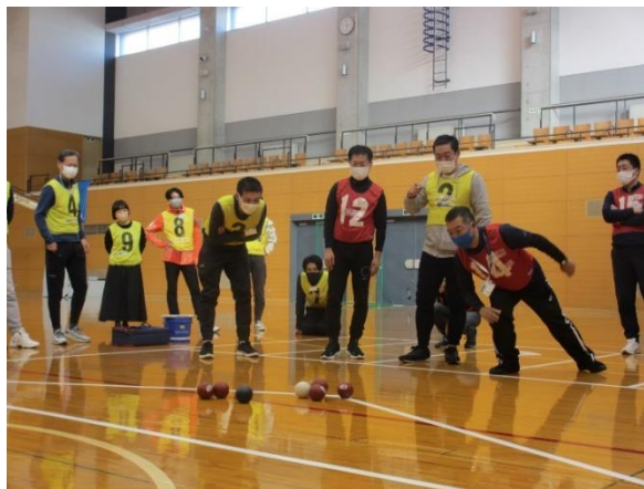
ボッチャ競技の奥深さに 参加者の表情も真剣そのもの