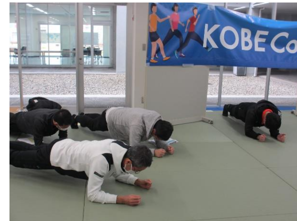
第1種目「プランクチャレンジ」に 挑戦する参加者